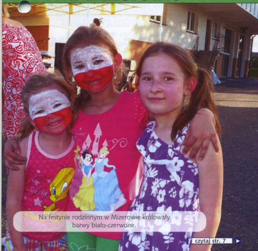
Na festynie rodzinnym w Mizerowie królowały barwy biało-czerwone.