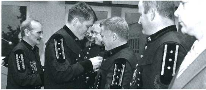
Były wspomnienia, gratulacje, odznaczenia i tradycyjne górnicze zwyczaje.

Życzenia, podziękowania i odznaki dla zasłużonych - tak wyglądała Barbórka w kopalni „Krupiński”.