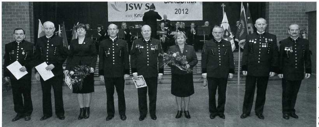
Za wzorowe i sumienne wykonywanie obowiązków nagrodzono pracowników kopalni medalami nadanymi przez Prezydenta RP.

- Niech ten szczególny dzień jest okazją do wyrażenia słów wielkiego uznania dla Waszej ciężkiej i pełnej poświęcenia służby, z którą wiążą się ciągle zagrożenia –