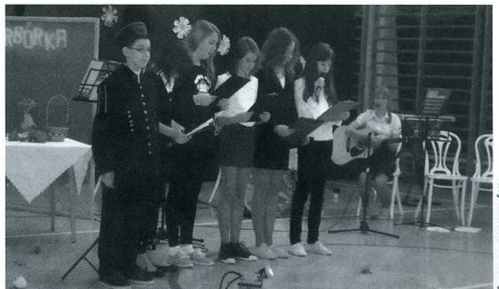
Z okazji Barbórki uczniowie zorganizowali uroczystą akademię.

Po apelu górnicy zostali zaproszeni na śląskie ciasto z czarną kawą oraz otrzymali symboliczne upominki – czarne jak węgiel kartki z życzeniami.